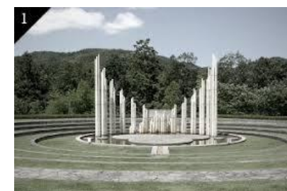
【人道の丘モニュメント】